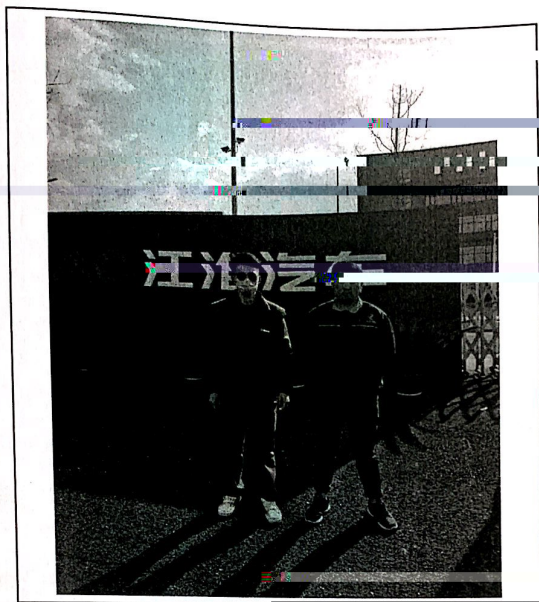
现场监测人员与江淮汽车工作人员合影